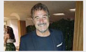
Ospite Pino Insegno alla festa di Antea