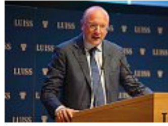
Presidente Vincenzo Boccia