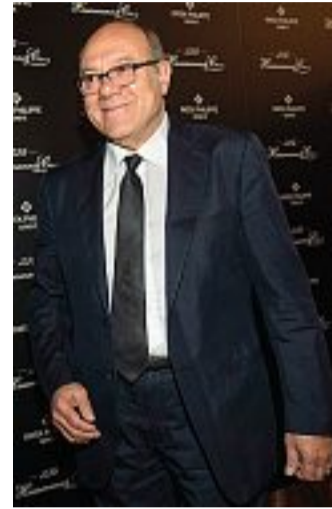
Regista e attore Carlo Verdone